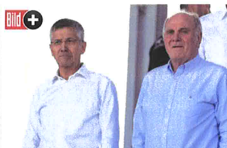
Bild+ SEIN WECHSEL WÜRD... Bayern mit Millionen-Ablöse für neuen Sport-B