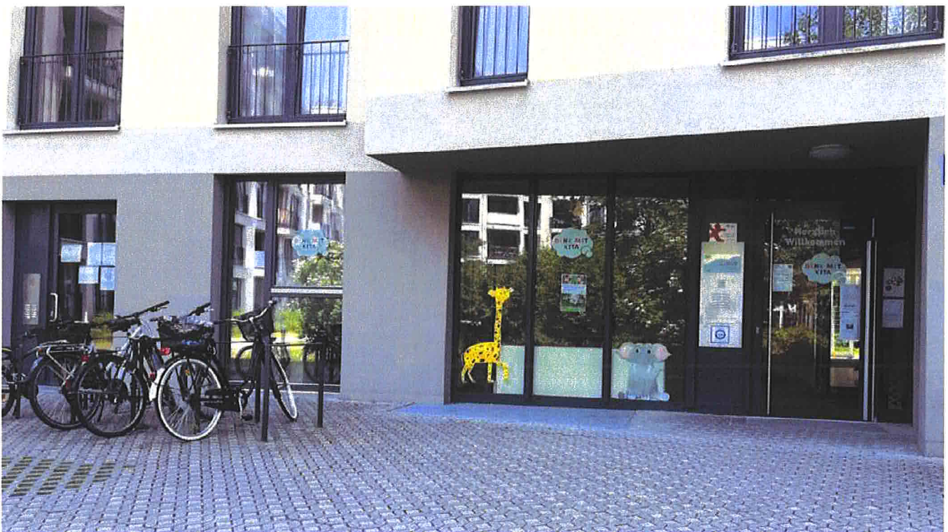
Der Tatort: Hier spielte sich die Ekel-Attacke ab